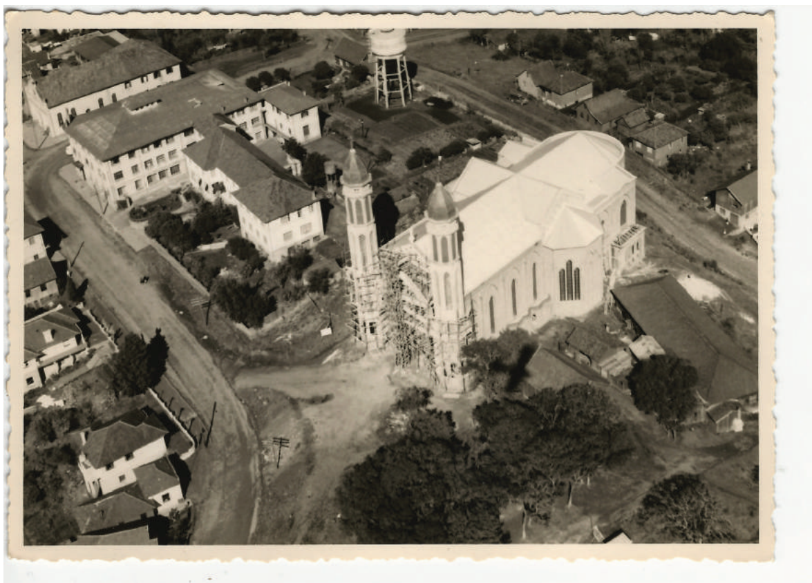
3. Atual Igreja Imaculada Conceição em construção, na foto é possível identificar a primeira igreja. Caxias do Sul, RS.