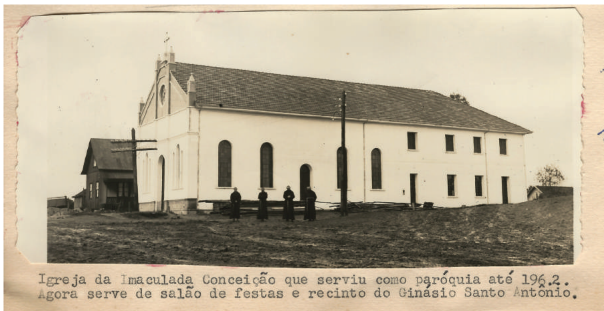
Igreja da Imaculada Conceição que serviu como paróquia até 1962. Agora serve de salão de festas e recinto do Ginásio Santo Antônio.