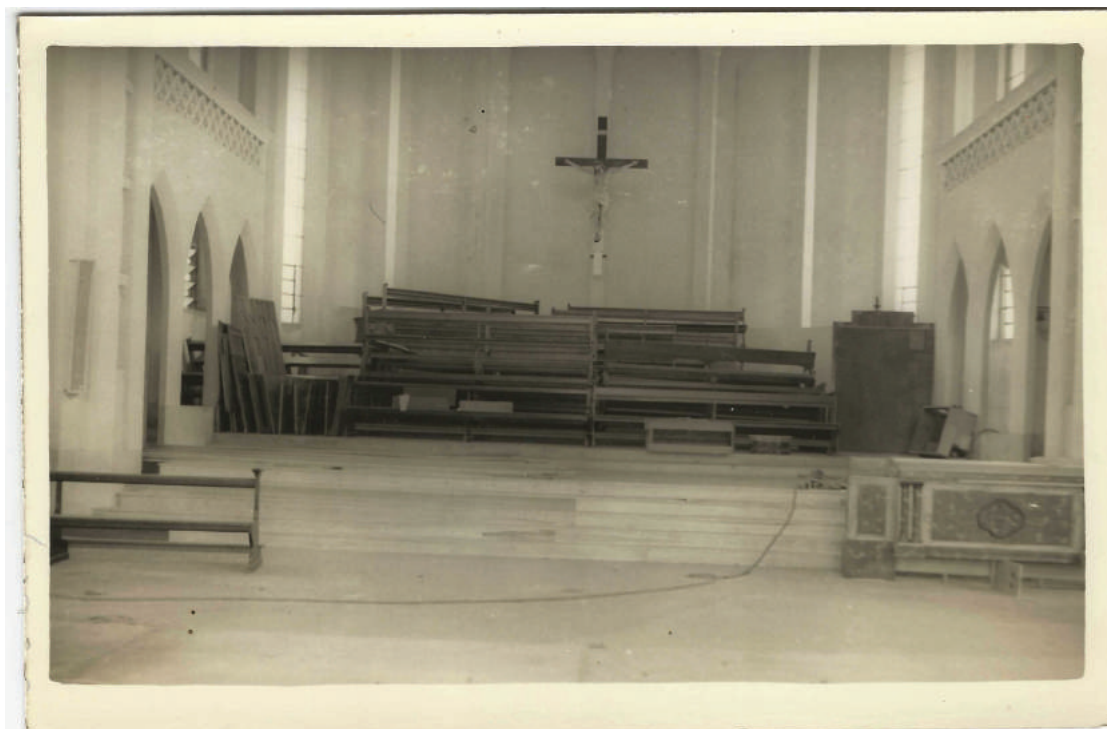
4. Interior da Igreja Imaculada Conceição, antes da inauguração. Caxias do Sul, RS.