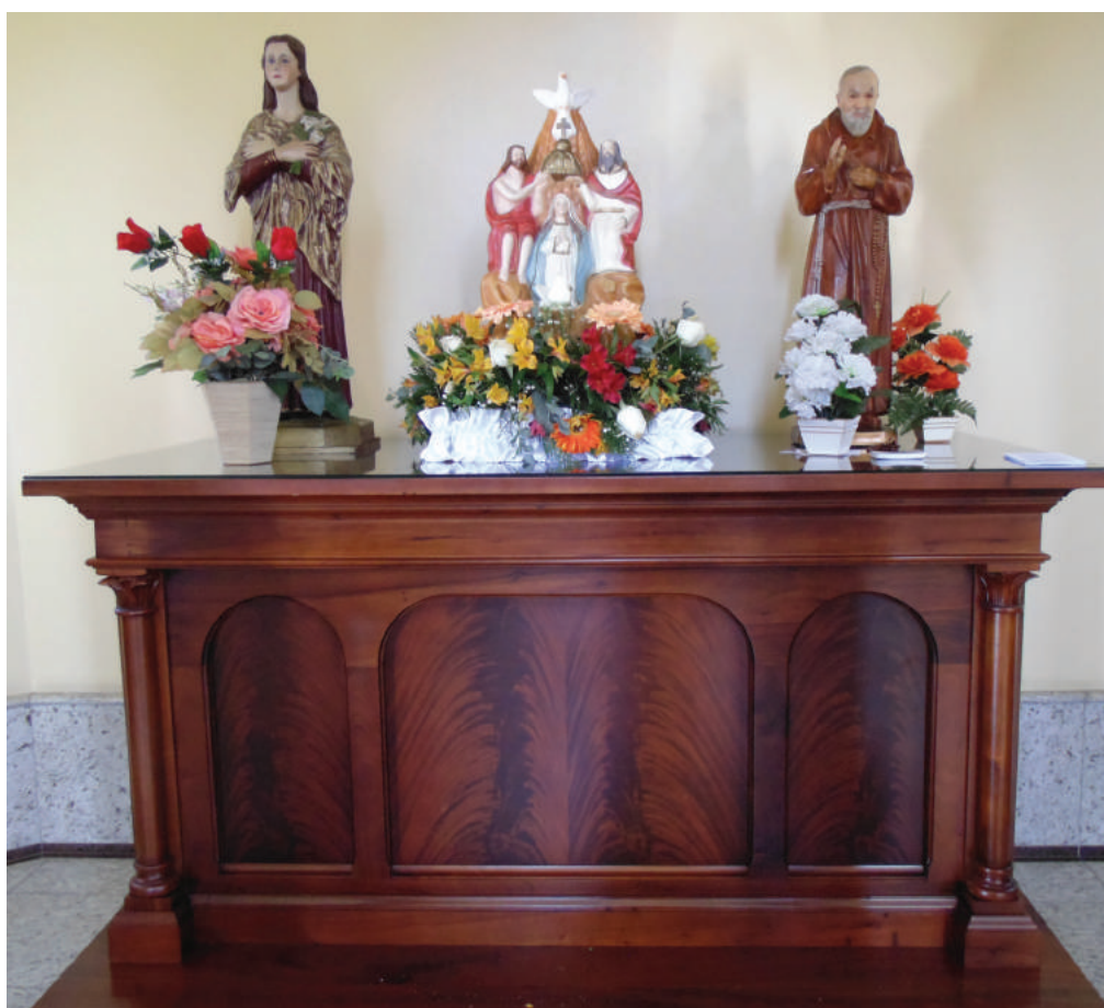
5. Interior da Igreja Imaculada Conceição. Altares atuais. Caxias do Sul, RS.