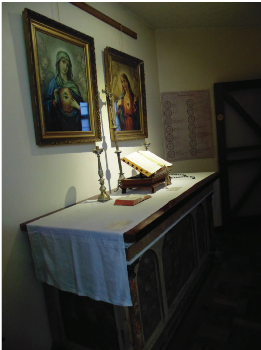
6. Exposição: O Tempo e a Vida dos Frades Capuchinhos.